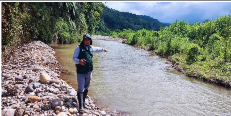
FIGURA N°01: TRAMO DEL RIO PENDENCIA COLMATADO, AFECTANDO SEMBRIOS DE