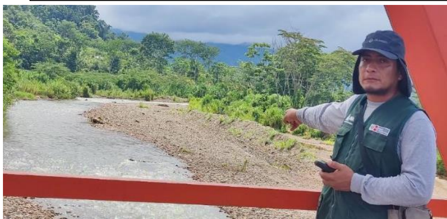
FIGURA N°02: TRAMO DEL RIO PENDENCIA COLMATADO, AFECTANDO