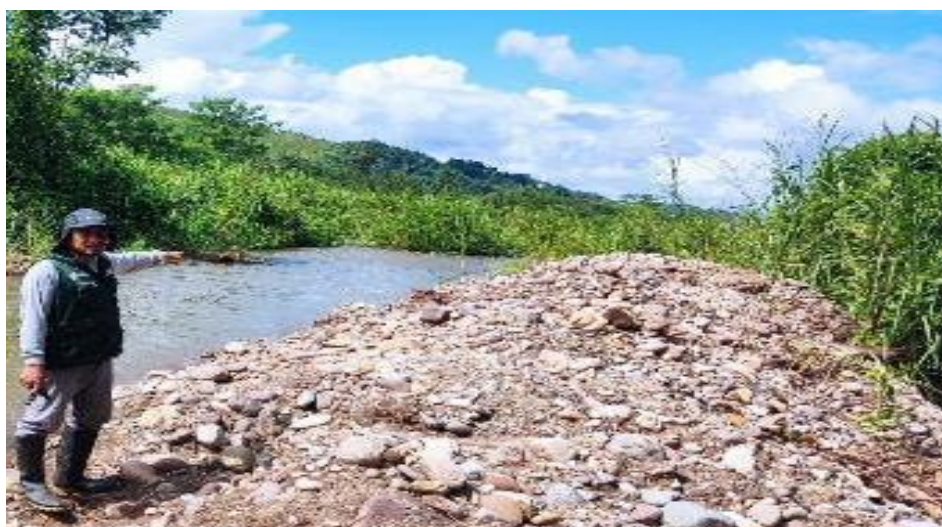
FIGURA N°03: TRAMO DEL RIO PENDENCIA COLMATADO, AFECTANDO